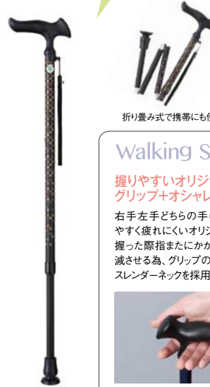
折り畳み式で携帯にも便利