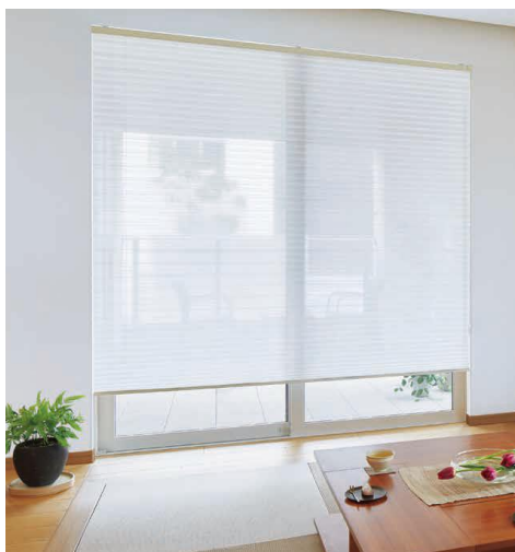
しおり 25 チェーンシングル TP-8147(ホワイト) 部品カラー:ホワイト 【参考価格】W1,800mm×H1,800mm 51,370円(税込)

生地裏面に光沢のある糸を使用し、太陽光を反射させることで外から見えにくい「ミラー効果」をもったシアースクリーン。遮熱性能もあわせもち、室内の温度上昇を抑えながら日の光を採り込むことができます。