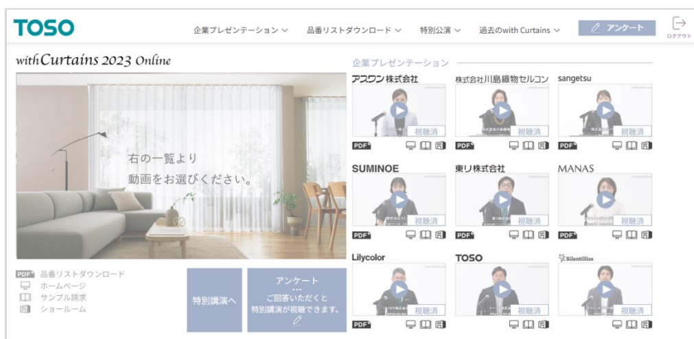
(アーカイブ配信画面イメージ)

「with Curtains」は、日本を代表するインテリアテキスタイルメーカーのマーケティング・商品開発担当者より、自社製品の開発背景やコーディネート提案などを直接聞くことができるイベントです。本イベントオリジナルのプレゼンテーションをパソコンやスマートフォンでお気軽にご視聴いただけます。ライブ配信を見逃した方も、もう一度見返したい方もぜひ特設サイトよりご参加ください。