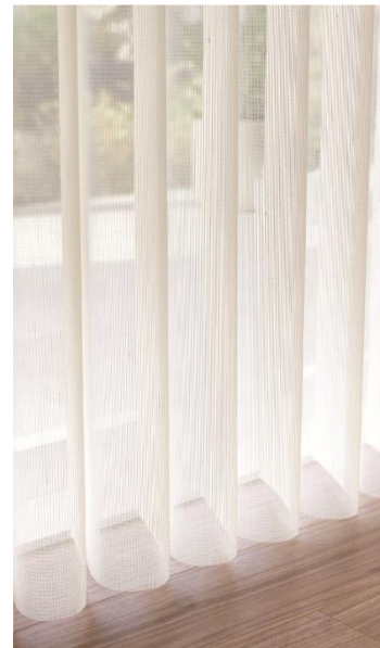
スリーヌ ノバントタイプ TU-1003(ソリア サンドベージュ) 部品カラー:グレージュ 【参考価格(税込)】 148,280円 (W1,800mm×H1,800mmの場合)