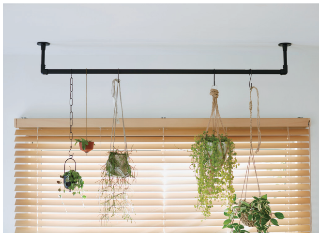
ブラック 天井付 Cタイプ 製品高さ150mm