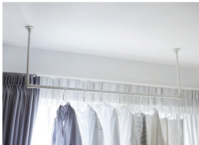
ホワイト 天井付 Cタイプ 製品高さ450mm